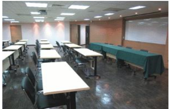
第二會議室(十二樓) 容納人數：40 人