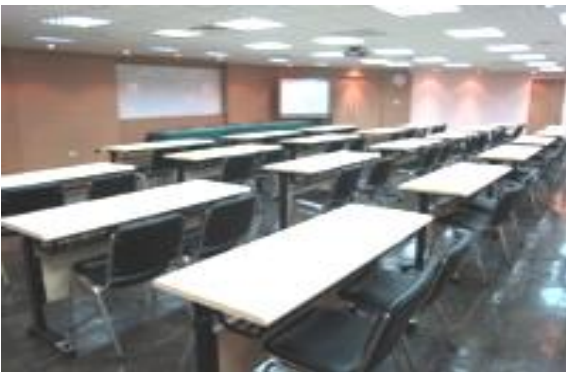
第一會議室(九樓) 容納人數：75 人